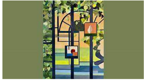
De groene kathedraal van Anneke Ingelse

'God houdt van kunst': velen onder u zullen dat vermoedelijk beamen. Maar vanzelfsprekend is dat niet. Denk alleen maar aan de Beeldenstorm, ruim 450 jaar geleden. Waarbij de spanningen tussen rooms-katholieken en protestanten hoog opliepen. Beelden kapotgeslagen werden. De beeldenstormers van destijds beriepen zich ook op een passage uit Exodus. Op het gebod: "Maak geen godenbeelden" en "Kniel niet voor zulke godenbeelden neer" (Ex. 20:4,5). Daarnaast vond men ook steun in de Heidelbergse Catechismus waarin het beeldverbod nog wat breder werd getrokken. Afbeeldingen mochten in de kerk niet worden gebruikt. Want God wil zijn volk niet