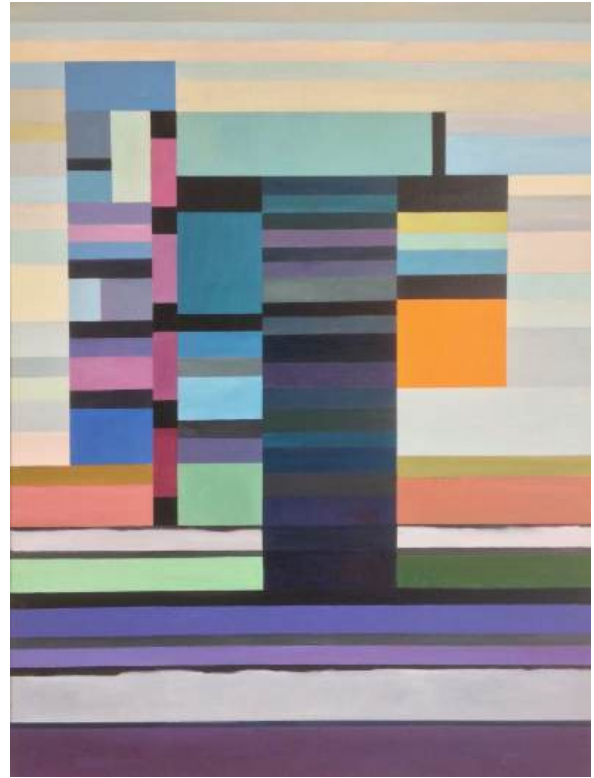
Rhythm and blue, Anneke Ingelse