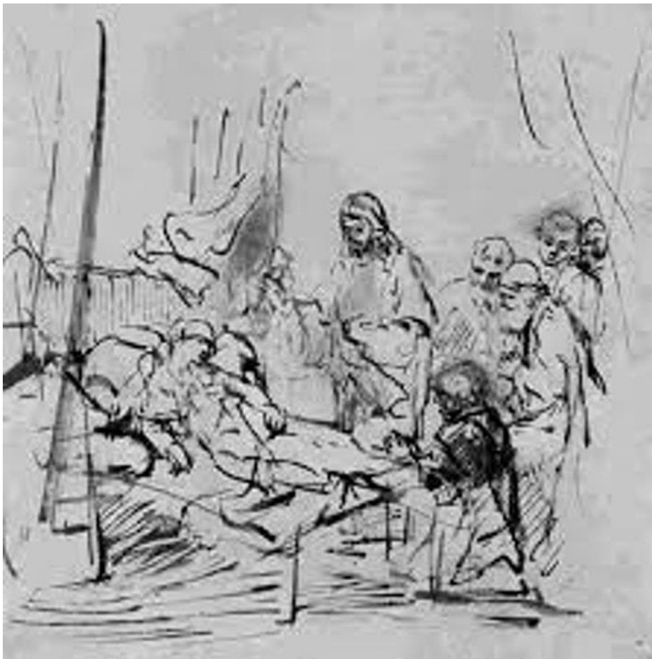
Rembrandt, De dochter van Jäirus