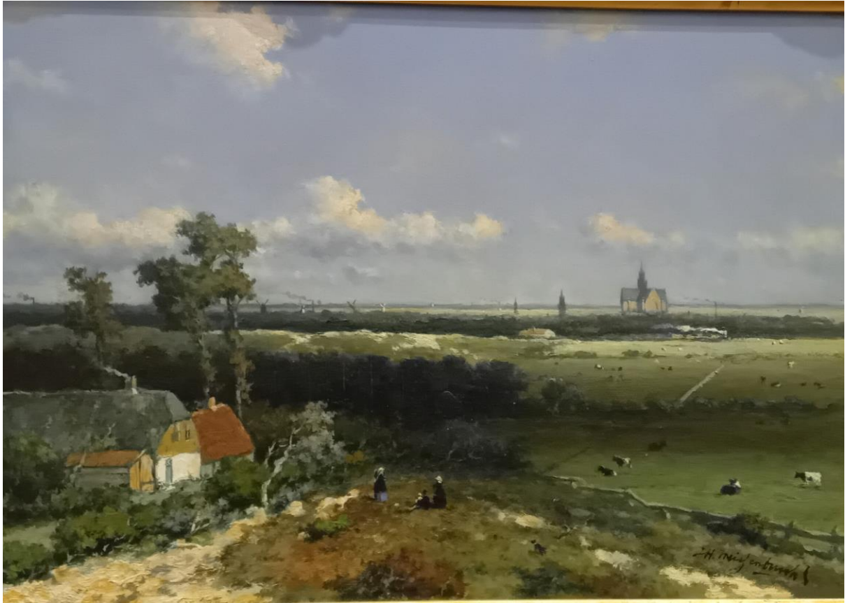
Jan Hendrik Weissenbruch – Gezicht op Haarlem (1845/'48)