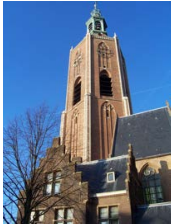
Grote kerk of St. Jacobskerk Den Haag