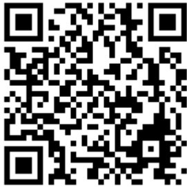
QR code Diaconie

U kunt voor uw bijdrage aan de collecte ook onderstaande QR-codes gebruiken: