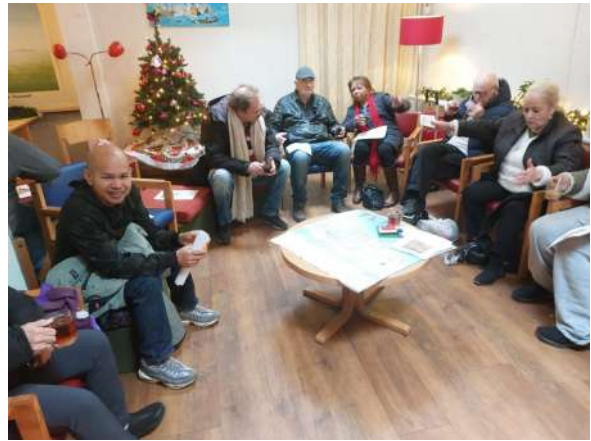
Gesprekskring in het Aandachtscentrum

Het Aandachtcentrum kan hier veel mooie dingen mee doen.