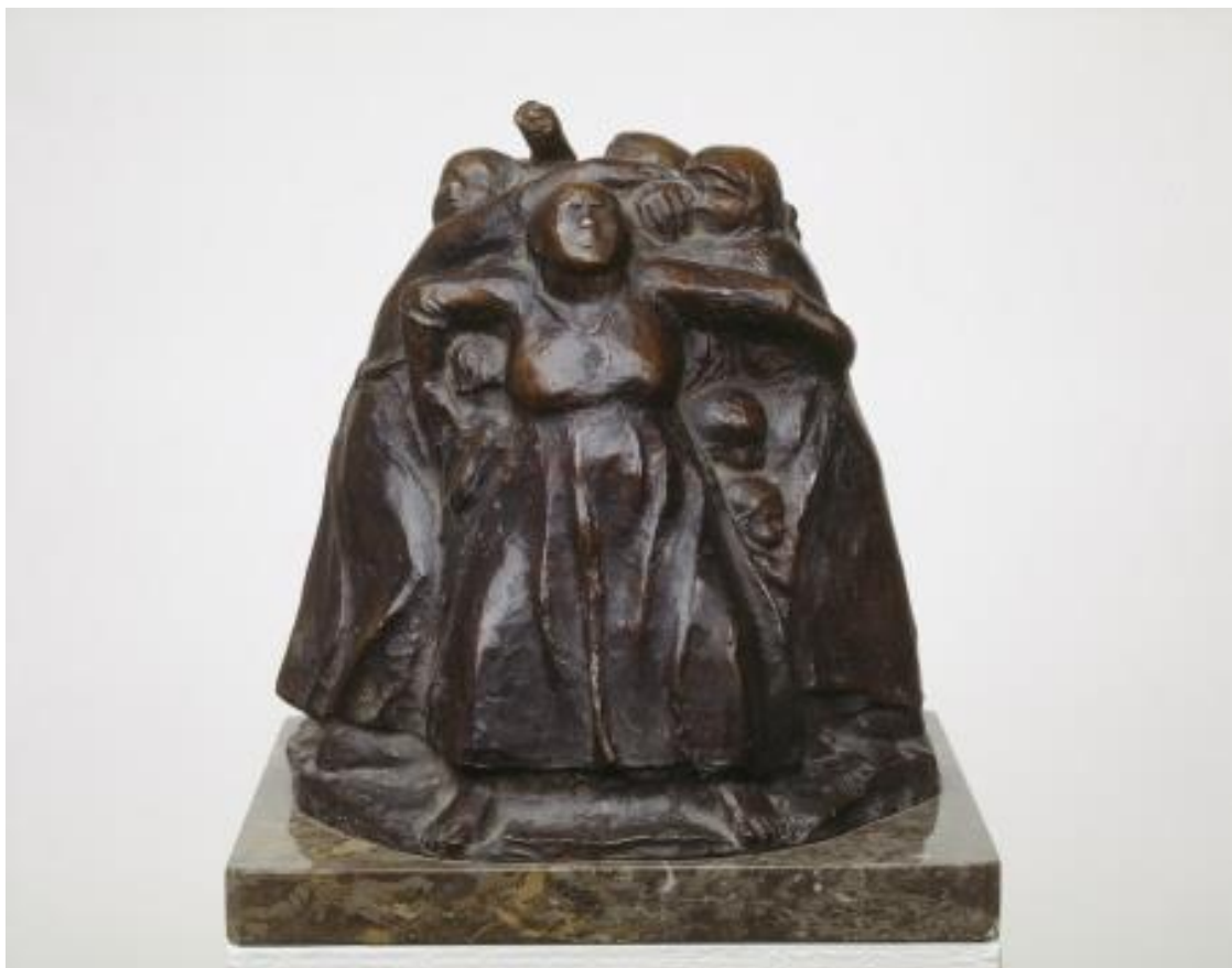
Turm der Mütter (Käthe Kollwitz)

Orde voor de dienst met breken en delen van brood en wijn op zondag 17 september 2023 in de remonstrantse kerk te Den Haag