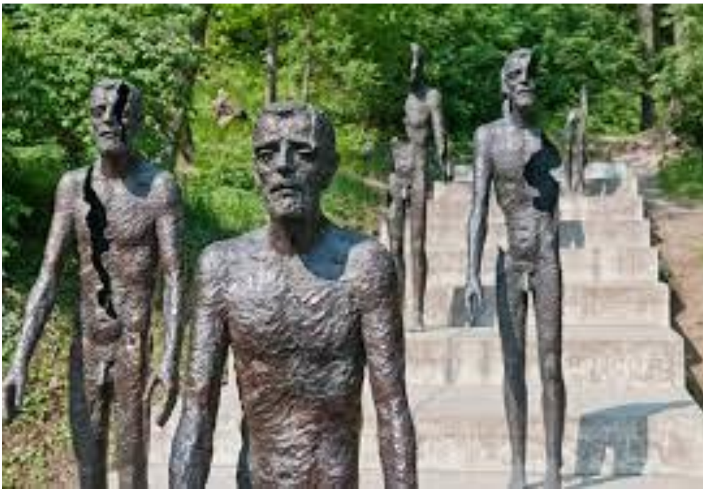
Beelden in Praag

Ken je mij? Wie ken je dan? Ken jij mij beter dan ik?