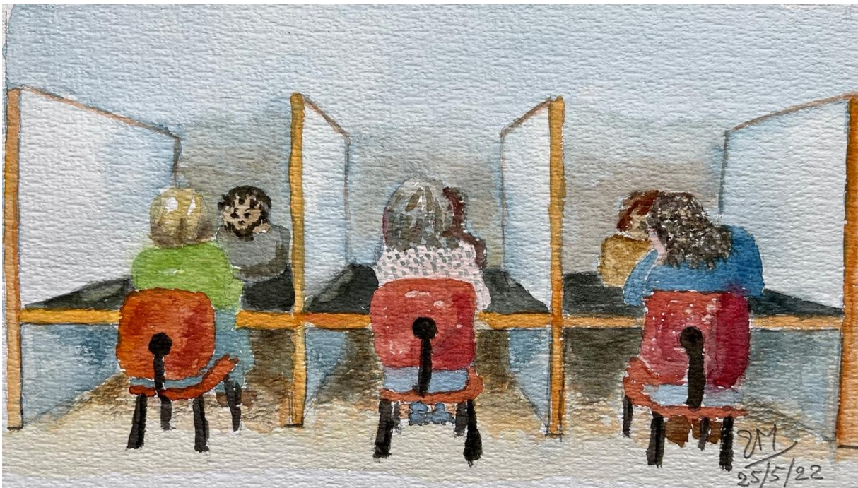
Illustratie Ettjen Modderman