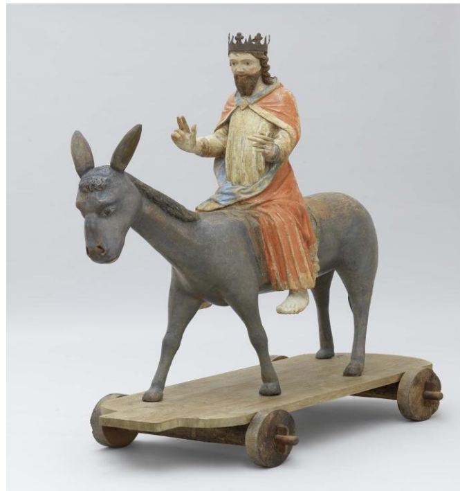
Jezus op een palmezel