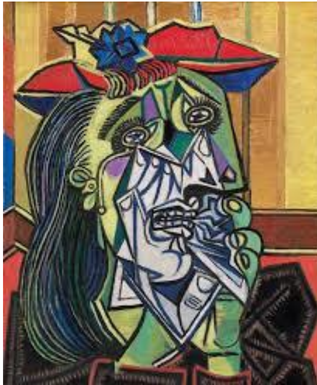
Weeping woman (1937), Pablo Picasso @Tate, London