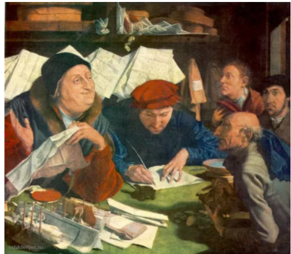
'De tollenaar' van Marinus van Reymerswaele

Sinds de kinderopvangtoeslagenaffaire zijn belastingambtenaren niet erg populair meer. In Bijbelse tijden was dit met tollenaars weinig anders. Meer lezen