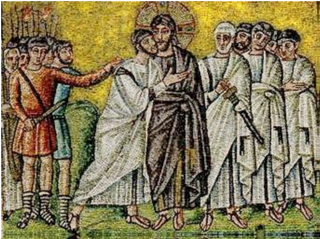
Mozaïek met de Judaskus (6e eeuw) uit de basiliek San Apollinare Nuovo in Ravenna