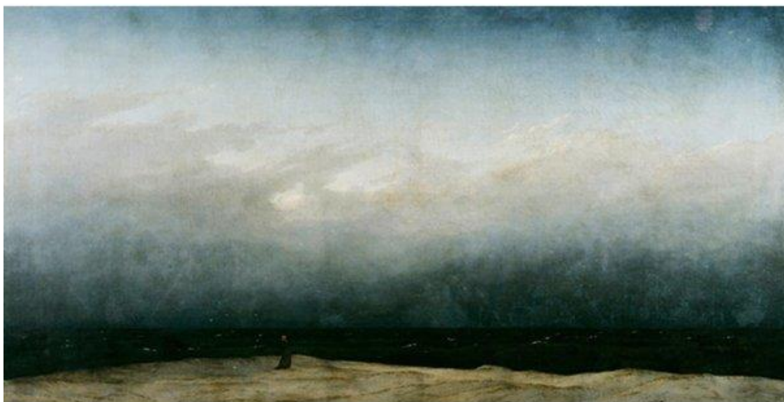
De monnik bij de zee (rond 1809) Caspar David Friedrich

Er moeten mensen zijn die lente maken van gevallen bladeren, en van gevallen schaduw, licht.