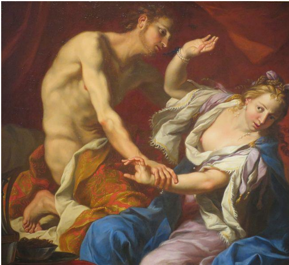
Amnon en Tamar (Kunstenaar onbekend, ca. 1650-1700, High Museum of Art)