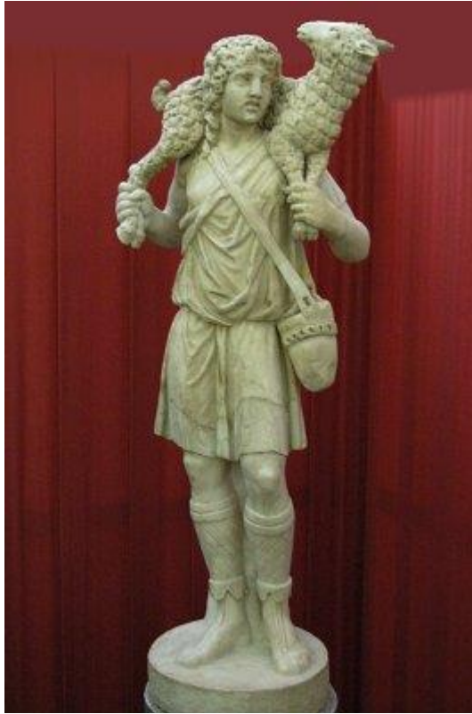
Marmereen beeld van Jezus als de Goede Herder met een verloren schaap om zijn schouders Rome, 4 e eeuw