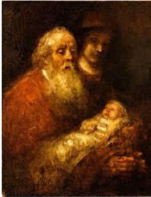
Simeon en Hanna met Jezus in de tempel Rembrandt

Aanvang 10.30 uur Voorganger: ds. Reinhold Philipp Organist: Hans Jacobi