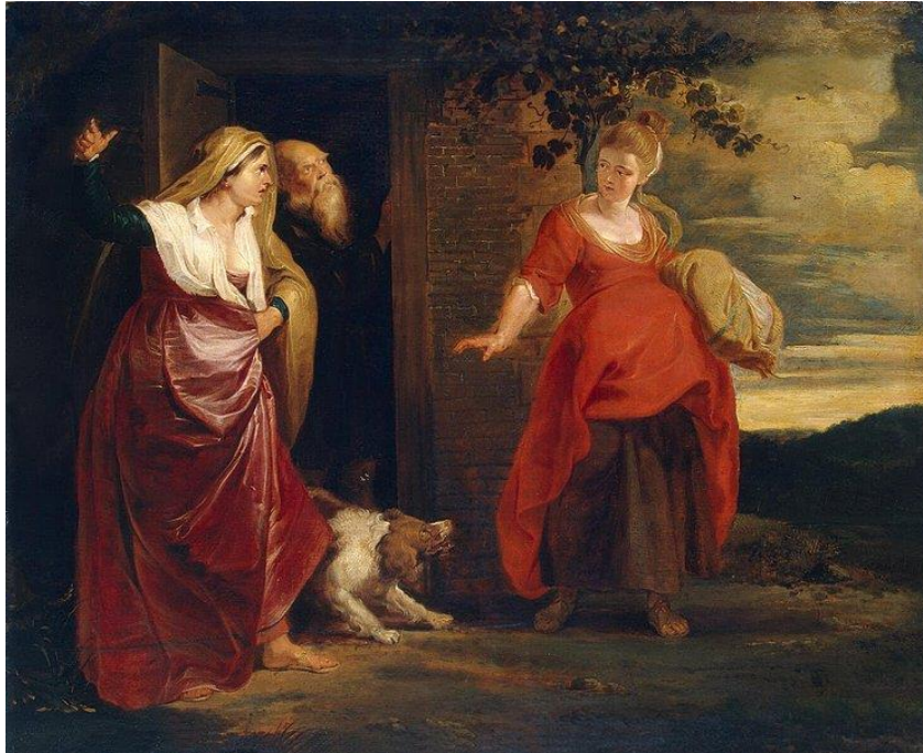
Hagar verlaat het huis van Abram – Rubens (1577 -1640)

Vorbereiding Orgelspel/ Welkom en aansteken van de kaars