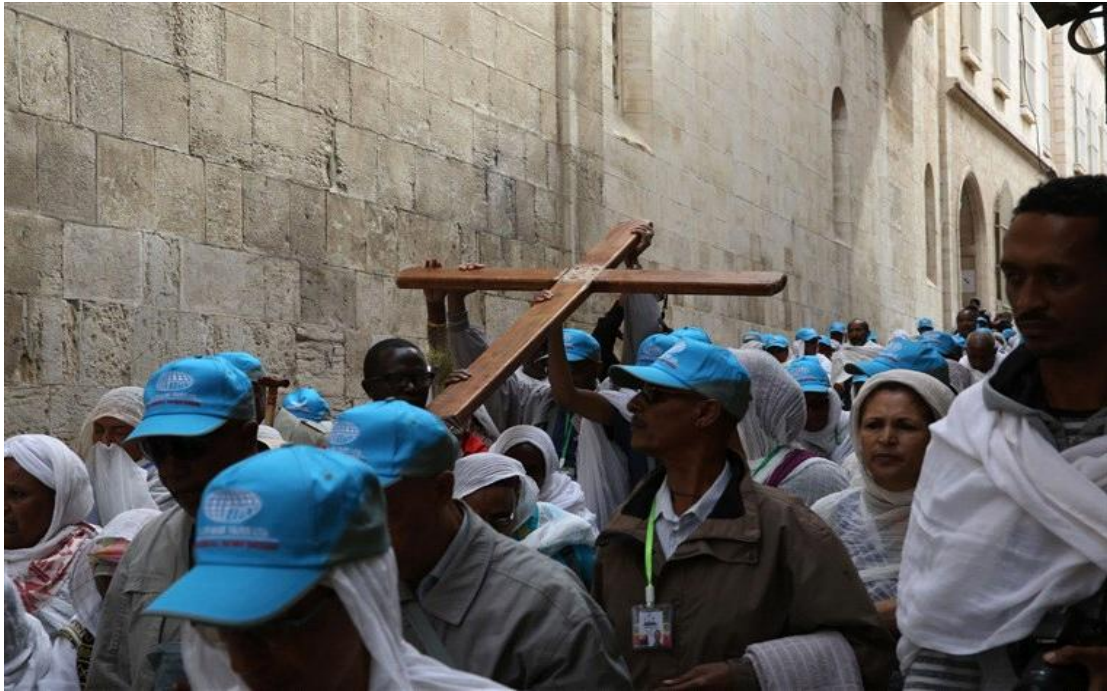
Pelgrims dragen het kruis - Via Dolorosa (Jeruzalem)