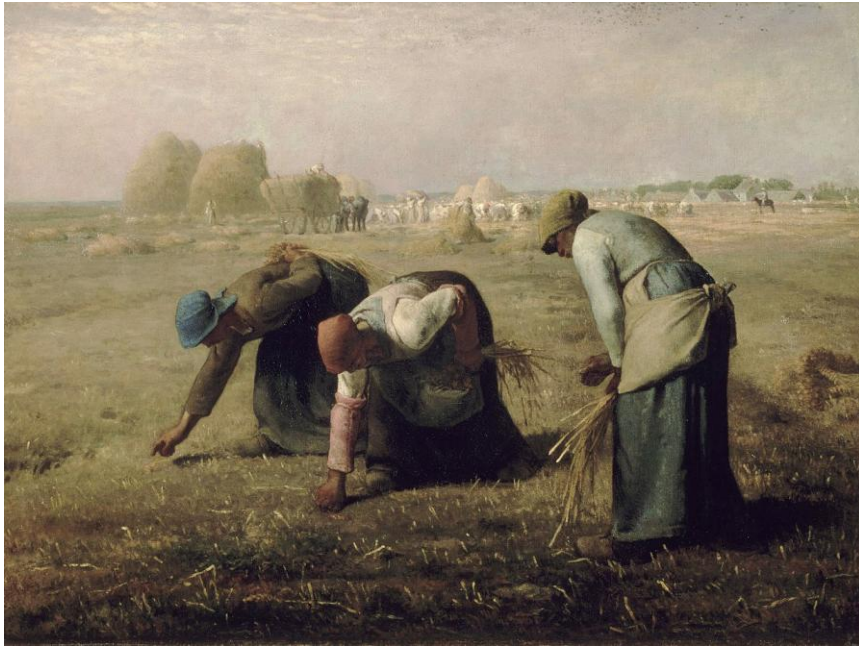
Jean-Francois Millet schilderde in 1857 Les Glaneuses (De Arenleesters); drie arme vrouwen die, nadat het graan geoogst is, losse aren verzamelen.