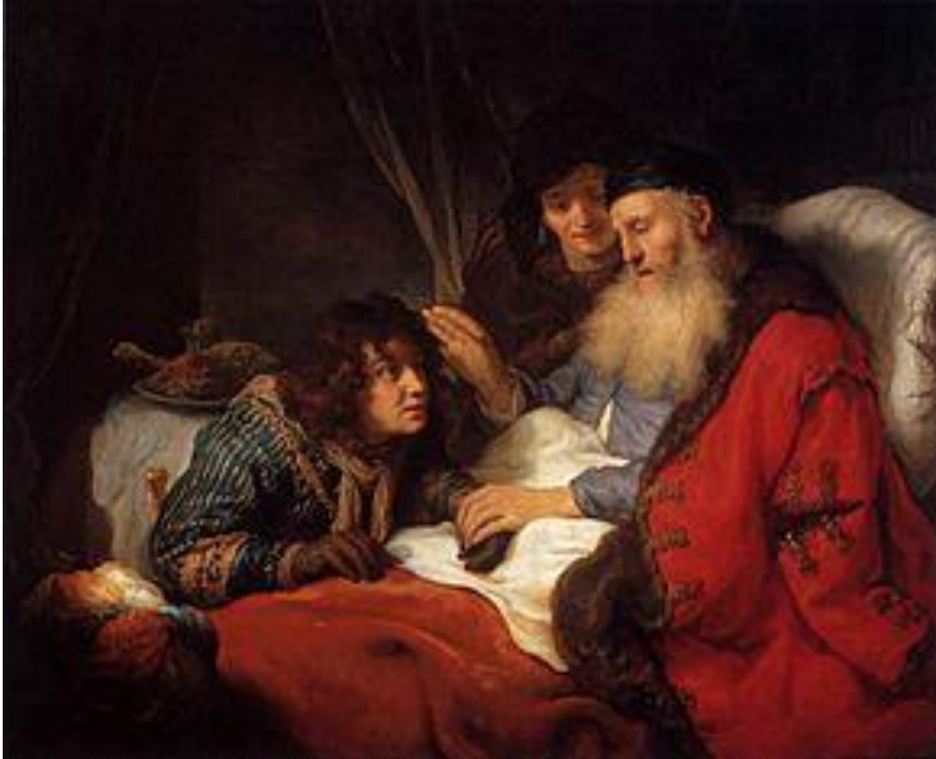
Isaac zegent Jakob - Govert Flinck 1638 (Rijksmuseum Amsterdam)